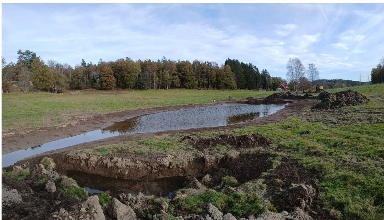
Figur 4: Framtagande av våtmark. (2025-10-20).

Efter inkommande kulvert från vägen som släpper vatten från ett tillrinningsområde på omkring 23 hektar har en våtmark anlagts. Våtmarken har främst anlagts genom dämning, enbart ytterst lite schaktning behövdes för själva våtmarken.