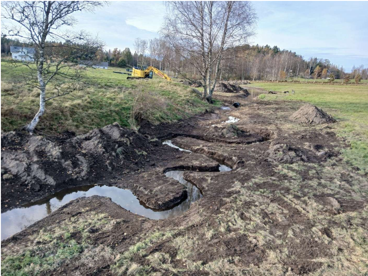
Figur 6: Meandrande del av bäckfåran. (2025-10-20)

Två överfarter över vattendraget gjordes. Detta för att underlätta för framtida brukning av marken. I en svacka mellan de två överfarterna anlades även svämplan till vattendraget.