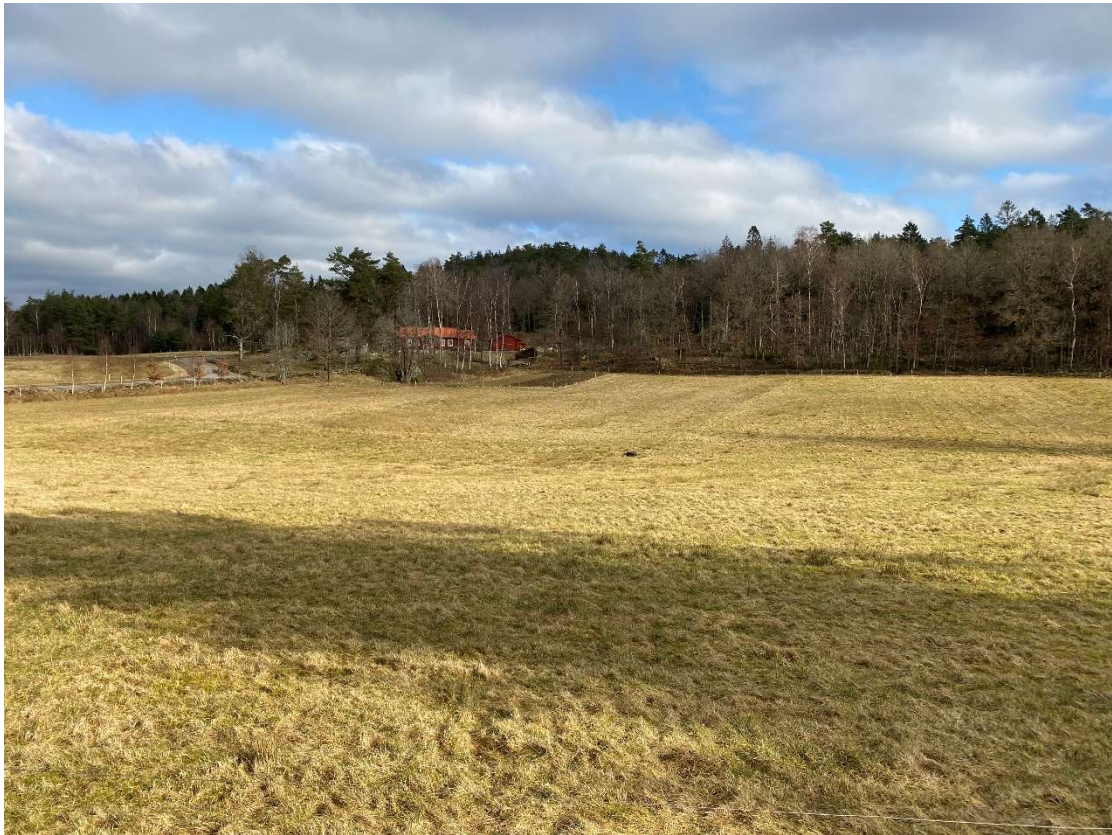
Figur 2: Bild innan åtgärd. Foto taget vid platsbesök i mars 2024. 8+ffjorlar