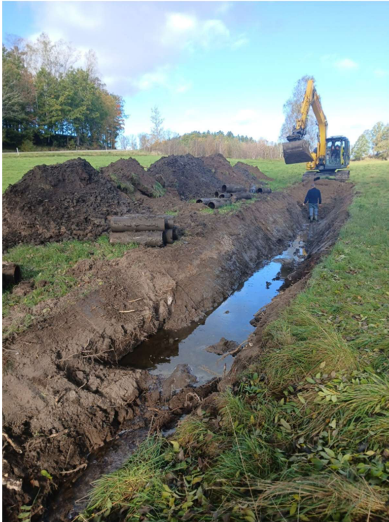
Figur 5: Upptagning av kulvert och grävning av ny bäckfåra.

Efter våtmarken har en kulvert tagits upp där vattendraget tidigare letts. Den nya fåran går i samma sträckning som den upptagna kulverten. I samband med att kulverten togs upp och bäckfåran återskapades behövdes en del grävarbete göras.