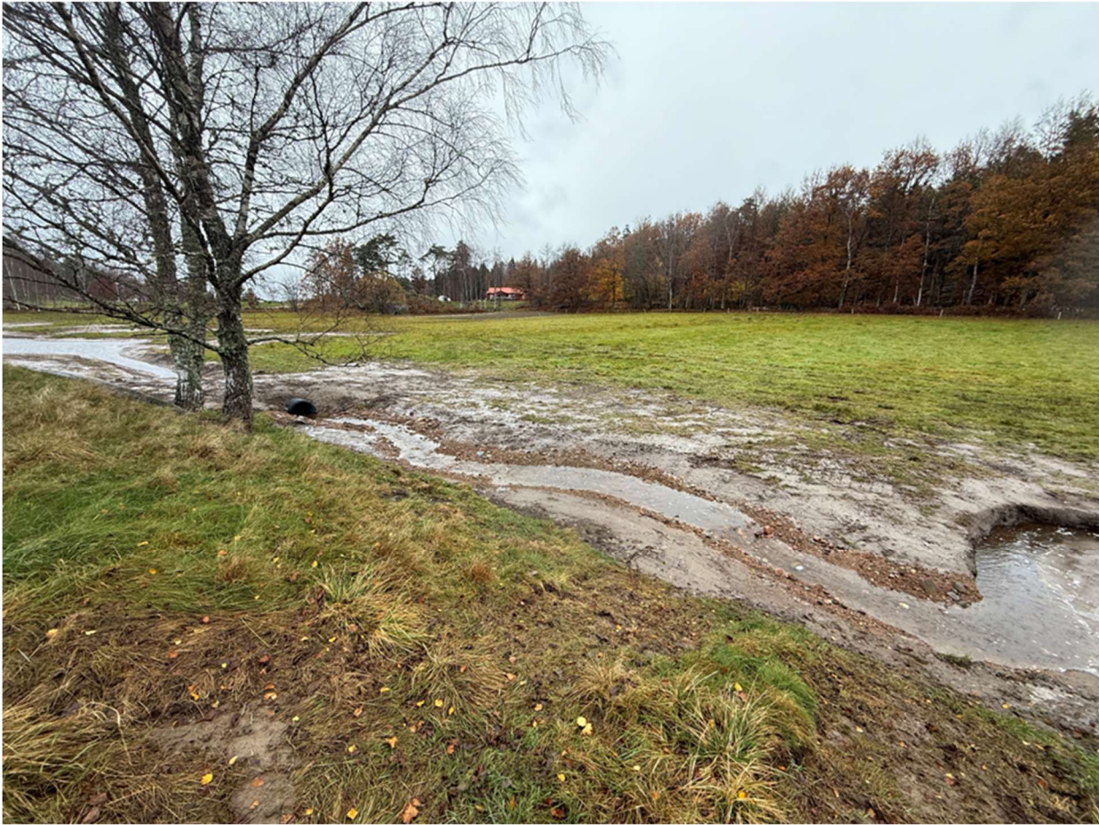
Foto 7. Färdig åtgärd. (2025-10-30)